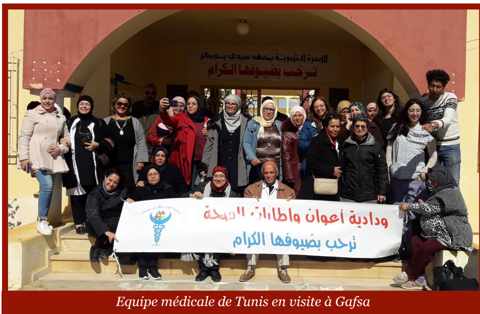
Equipe médicale de Tunis en visite à Gafsa