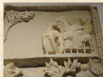
Bas-relief du IV ème siècle trouvé à Carthage : « Notre Dame de Carthage » (Pièce de l'exposition).